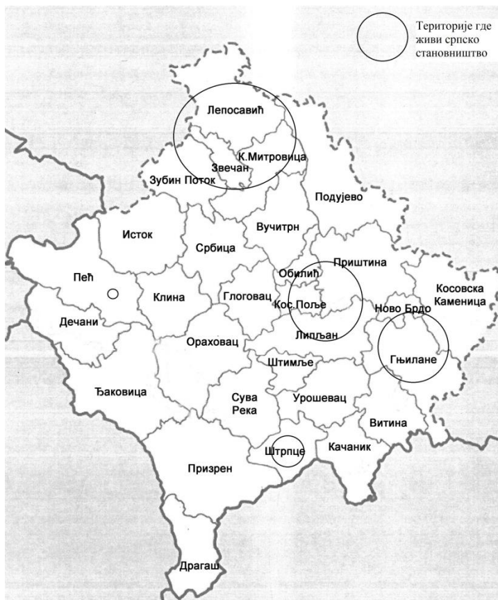
Fig. 2. Serbian population in Autonomous Province Kosovo and Metohija, 2022

Contemporary demographic determinants also point to the problem of the erasure of certain nationalities (Montenegrins, Muslims, Yugoslavs, Macedonians) and the formation of new ones (Bosniaks, Ashkali, Egyptians). Thus, according to the 2011 census, there are no Montenegrins at all, up to 30.000 according to earlier censuses. All this can lead us to conclude that Montenegrins have declared themselves either as Serbs, or have emigrated or are categorized as "Others", "Does not want to declare" or "Does not know" with a total population of 5,104. This phenomenon points to the malicious tendency of the provisional Kosovo authorities to erase, all the parameters that determine the Serb ethnicity and the existence of the Serbian national being in the territory of Kosovo and Metohija.