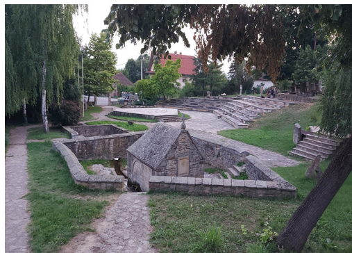
Slika br.1: Centar naselja Bela Voda

Na području pod režimom III stepena zaštite vrše se upravljačke intervencije u cilju unapređenja zaštićenog područja i seoskih domaćinstava, uređenje objekata kulturno-istorijskog nasleđa i tradicionalnog graditeljstva, očuvanja tradicionalne delatnosti.