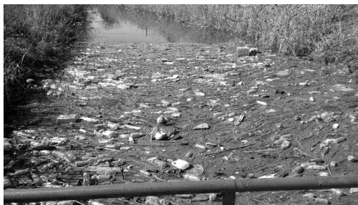
Slika 3. Kanal Kalovita (Samardžić I, 2016)

Monitoring zemljišta se vrši obično izvan stambenih kompleksa u ovom delu Grada, dok su vrednosti buke uvećane u zoni prometnih saobraćajnica, ali zbog nepostojanja mernih mesta za kontrolu nivoa buke ne mogu se prikazati egzaktni podaci. Kvalitet vazduha se u periodu