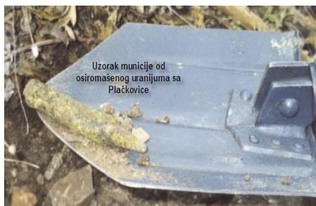
Slika 1. Uzorak municije sa Plačkovice

Pri udaru uranskog projektila u čvrstu prepreku stvara se visoka temperatura i oko 10% urana sagoreva u uranoksid, a 70% prelazi u stanje aerosola (fine čestice poput magle). Veličina aerosolnih čestica urana je oko 5µm. Ove čestice kontaminiraju okolnu sredinu mogu se uneti u organizam udisanjem ili hranom, a zavisno od meteoroloških uslova, mogu se raznositi na veće udaljenosti (do 40 km). Oksidi urana su delimično rastvorljivi u vodi, pa mogu kontaminirati podzemne vode, i dospeti u lanac ishrane ljudi.