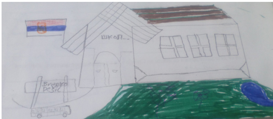
Slika 2. Crtež dece migranata o percepciji škole

Deca su uglavnom motivisana da idu u školu jer žele da nauče jezike, upoznaju drugu kulturu i običaje, steknu nove drugare, korisno iskoriste vreme i upoznaju se sa evropskim sistemom školovanja. Sa druge strane neka od njih su zabrinuta zbog sporazumevanja sa nastavnicima i vršnjacima. Sticanju uvida u način funkcionisanja školovanja doprinose opisi četvero dece migranata iz grupe sa kojom se realizuje program učenja srpskog jezika.