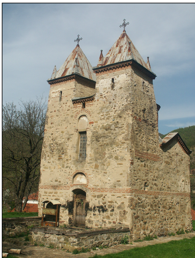
Слика 2. Доњокаменичка црква

овде првобитно била изграђена црква чатмара, а да је по њеном паљењу нову цркву подигао деспот Лазар, син деспота Ђурђа Бранковића. Према обновљеном запису из 1848. године манастир је изграђен 1457. године. Фрескопис је сада само фрагментирано дат после рестаурације, обзиром да је у ранијем периоду ово здање више пута рушено и обнављано (Стојадиновић Б. 1985.).