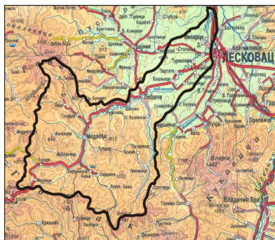
Слика 1. Географски положај слива Јабланице Figure 1. Geographic position of the Jablanica basin