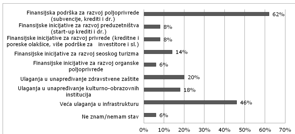
Grafikon 2. Prioritetne sfere angažovanja lokalne samouprave u narednom periodu

Shodno prepoznatim problemima ruralnog razvoja, lokalno stanovništvo smatra da jedno od prioriteta angažovanja lokalne samouprave u neposrednoj budućnosti bi svakako trebalo da bude i edukacija ruralnog stanovništva sa dostupnim aktivnostima i projektima u sferi ruralnog razvoja. Prema rezultatima anketnog istraživanja, čak 68% ispitanika nije upoznato ni sa jednom od navedenih aktivnosti – subvencije (robne kreditne linije) u ratarstvu, stočarstvu, vinogradarstvu i dr., krediti za mlade preduzetnike (start-up krediti), bespovratna sredstva za udruživanje poljoprivrednika, edukacija poljoprivrednih proizvođača, sredstva za podsticaje za diversifikaciju poljoprivrednih gazdinstava i razvoj seoskog turizma i edukacija za bavljenje seoskim turizmom.