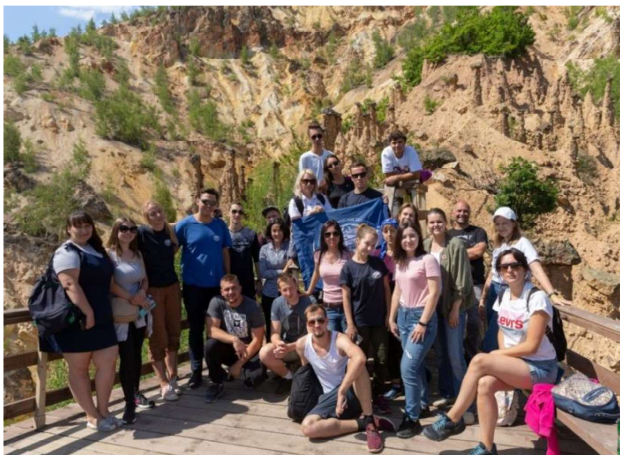
Слика 5. - Обилазак Ђаволје вароши

Дванаестог дана учесници одлазе у село Игош, где посећују фабрику органске хране - Фудленд. Након дегустације воћних сокова и других слатких производа, пут нас води до оближњег активног површинског копа и погона за прераду зеолита. После краћег предавања на терену о постанку и карактеристикама зеолита, најхрабрији су одлучили да пробају овај лековити минерал. Локални вашар који се у ово време одржавао у Брусу пријатно је изненадио госте који су пробали и куповали бројне домаће производе. У вечерњим сатима организован је обилазак локалитета Гвоздац и Велико Метође (пешачка тура), да би касније уследила вечера и заједнично дружење у Брзећу.