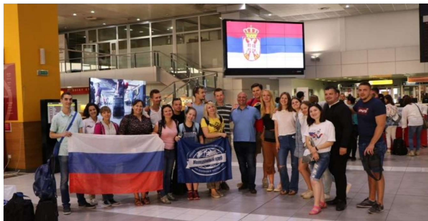
Слика 6. - Испраћај руских колега на аеродрому

Поподне из центра града експедиција је кренула ка Аеродрому. Одлична теренска настава и срдечно дружење током кампа резултирала су пуно осмеха, али и суза на расстанку српских и руских колега, у нади да ће се ускоро поново сви срести.