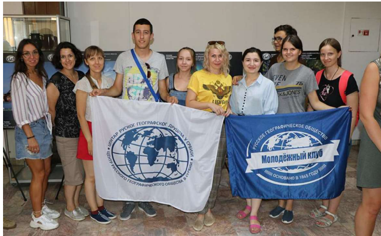
Слика 3. - Изложба фотографија у Брусу

ске, Лисине и Чајетине, долином Ибра кренуло се у обилазак средњовековних манастира Стара Павлица, Нова Павлица и Градац. Ручак је организован у Јошаничкој Бањи, након чега је уследила рекреација на базену у истоименом месту. У вечерњим часовима, заједничко дружење настављено је у Блажеву.