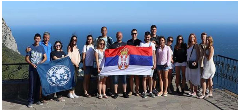
Слика 9. - Видиковац код Фароске цркве

Наредног дана експедиција се упутила ка заливу Балаклава, недалеко од Севастопоља. На овом месту је некада постојала војна база, која је бранила Севастопољ за време Кримског рата. Експедиција је изнад Балаклаве посетила и тврђаву Чембала. Након тога, учесници су бродовима изашли из залива, а следећа дестинација била је плажа Мис Фиолент. Током овог дана изнад плаже посећена је црква Св. Ђорђа, као и споменик Пушкину.