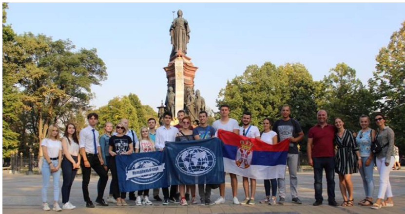
Слика 11. Српске и руске колеге у Краснодару

Шеснаестог дана рано ујутру учесници пуни прелепих утисака о Москви, Криму и Краснодару поздрављају се са руским колегама и са аеродрома у Краснодару крећу пут Београда, где слећу око 7 сати ујутру.