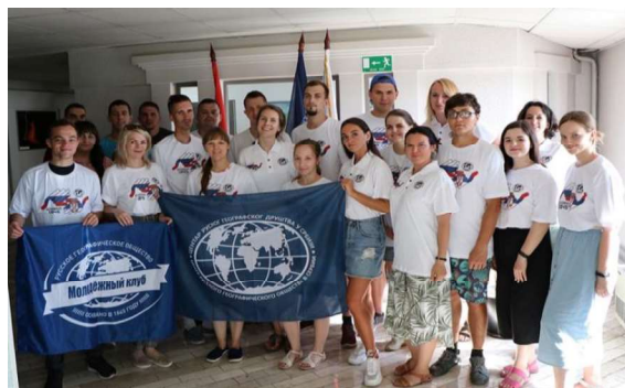
Слика 1. - Посета Центру РГД у Србији

Камп је одржан у периоду од 1-15. јула. Након слетања руских колега, организован је смештај и кратак поподневни одмор. Увече су гости имали прилику да први пут прошетају центром града и виде бројне знаменитости Београда. Музеји, галерије, споменици и седиште Центра руског географског друштва у Србији само су део богатог програма који је приређен у Београду прва два дана њиховог боравка.