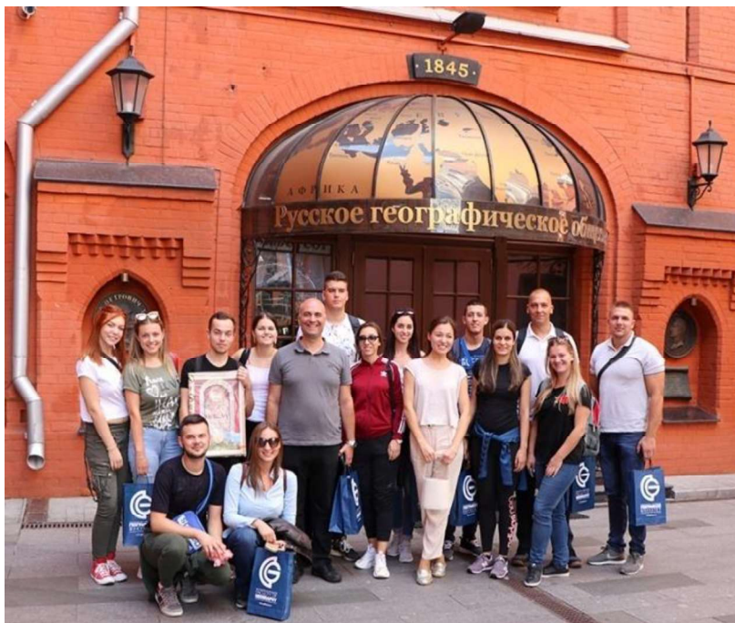
Слика 7. - Учесници у посети седишту РГД

посетили Кримски универзитет, али и многобројне туристичке атракције југоисточног Крима. Након једнодневнoг обиласка Москве и неколико дана проведених у престоници Крима – Симферопољу, посећена су следећа места, са различитом дужином боравка: Алушта, Судак, Феодосија, Бахчисарај, Алупка, Јалта и Севастопол. Последњег дана Кампа, учесници су уживали у шармантом Краснодару, некадашњем Јекатеринодару.