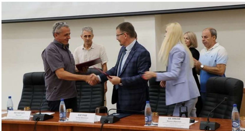
Слика 10. - Потписивање уговора о сарадњи

учеснике оставили чаробан утисак. У Краснодару, некадашњем Јекатеринодару, налази се и српска општина. Увече је организована шетња у прелепом парку око стадиона ФК Краснодар, као и предавање о астрономији у опсерваторији универзитета. Многи учесници су по први пут имали прилику да преко великих телескопа виде Сатурн и у рукама држе метеорит.