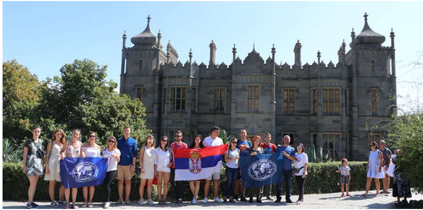
Слика 8. - Обилазак Воронцевог дворца

ције, последњи чланови породице напуштају дворец 1919. године, а од 1921. дворец има функцију музеја.