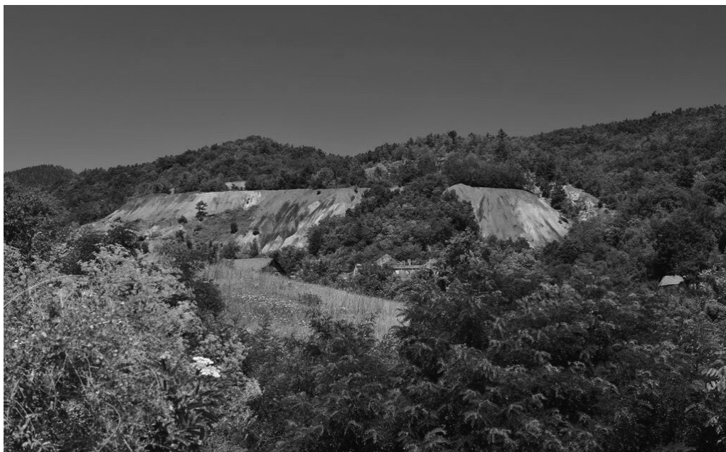
Sl. 2. Jalovište u selu Vina, opština Knjaževac

Veća svest o značaju okruženja dovela je do pooštavanja propisa koje sprovode mnoge zemlje kako bi se umanjio uticaj rudarskih aktivnosti. U razvijenim zemljama, rudarski radovi su sada usko regulisani, a uticaji na životnu sredinu se sve više kontrolišu. Savremeni rudnici vezani su za postojeće zakone o zaštiti životne sredine koji postaju strogi u razvijenim zemljama (Bell i Donnelly, 2006).