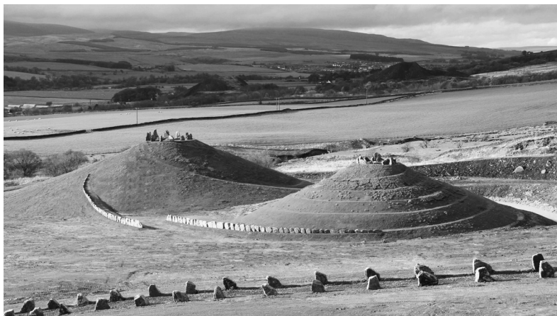
Sl. 4. „Cravick Multiverse“, Damfriz (Dumfries), Škotska

Važno je napomenuti da u Srbiji, kao i u mnogim zemljama širom sveta, postoje ostaci nekadašnjih rudarskih objekata koji danas propadaju, a mogu se revitalizovati i integrisati u turističku promotivnu ponudu (Carević i dr. 2017).